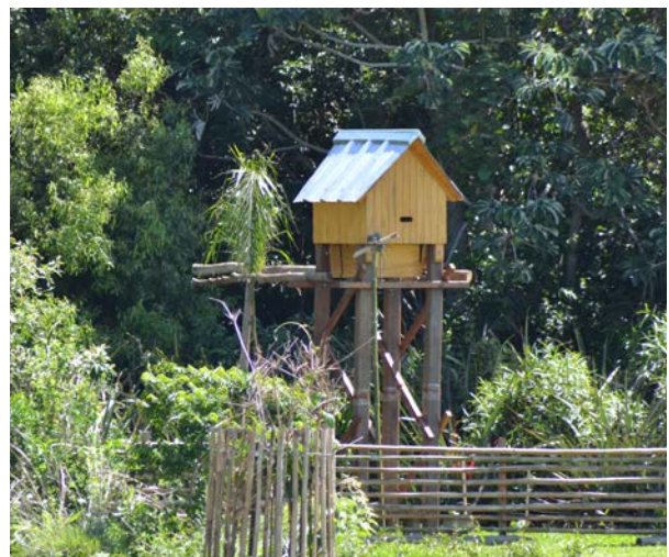
Figura 3. Refugio artificial, construido sobre borde de Monte Casa.

Las isletas de bosque higrófilo del área son las unidades de ambiente más importantes desde el