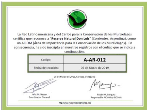
Figura 4. Certificado de reconocimiento del AICOM "Reserva Natural Don Luis", emitido por la RELCOM.

punto de vista de la conservación. Las mismas cuentan con varios refugios de oquedades en árboles, donde se han encontrado numerosas colonias permanentes (de 10 a 20 individuos) de Desmodus rotundus . Sin embargo, las construcciones antrópicas como cabañas y depósitos también son frecuentemente utilizadas como refugios estacionales por especies como Molossops temminckii y Eumops patagonicus . Adicionalmente, la reserva cuenta con refugios artificiales construidos en base a diseños específicos para murciélagos, con capacidad para albergar hasta 3000 individuos de diversas especies (Fig. 3).