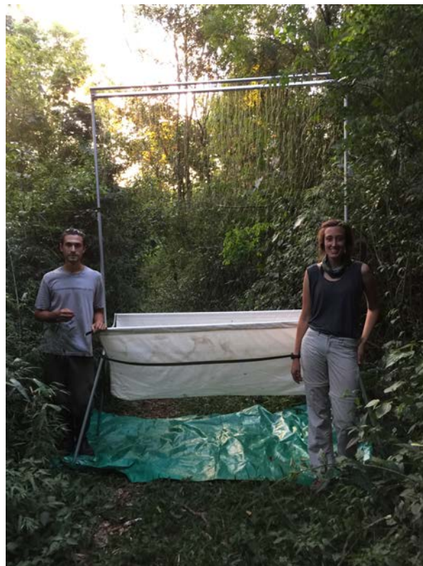
Figura 5. Actividades de monitoreo de especies utilizando trampa arpa.

Gracias a la gestión de las ONG's involucradas (Collett Trust for Endangered Species y Fundación Cambyretá para la Conservación de la Naturaleza), diversos proyectos de voluntariados son desarrollados en el área, centrados en el estudio y seguimiento de las colonias de murciélagos del área (Fig. 5), como también en actividades de difusión,