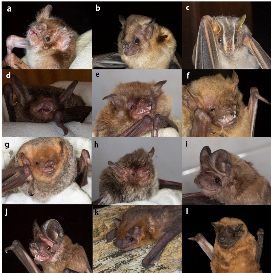
Figura 2. Murciélagos presentes en el AICOM Reserva Natural Don Luis: a) Desmodus rotundus , b) Sturnira lilium , c) Platyrrhinus lineatus , d) Myotis nigricans , e) Myotis riparius , f) Lasiurus ega , g) Lasiurus blossevillii , h) Eptesicus furinalis , i) Eumops bonariensis , j) Eumops patagonicus , k) Molossops temminckii l) Molossus rufus . Fotos: Miranda Collet.

Wildlife Acoustics Song Meter SM4BAT FS, Batbox Griffin. Todos estos relevamientos fueron realizados entre enero de 2017 y agosto de 2019.