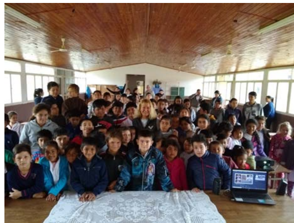
Figura 6. Charla-taller con alumnos de la Escuela n° 419-G.C Río Iguazú y pobladores de Isla Apipé Grande, Ituzaingó, Corrientes.

conferencias y talleres destinados a las comunidades cercanas a la reserva, a otras instituciones educativas y al público en general (Fig. 6).